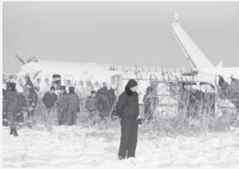
рейса. Проведен осмотр взлетно-посадочной полосы, с воздушного судна изъяты самописцы и бортовой журнал. Продолжается

Глава МВД подчеркнул, что следователям предстоит восстановить хронологию всех событий, предшествовавших авиакатастрофе. С этой целью сотрудники проверяют работу всех наземных и авиационных служб, участвующих в организации и проведении полетов, ведутся допросы ответственных лиц и опрос пассажиров данного